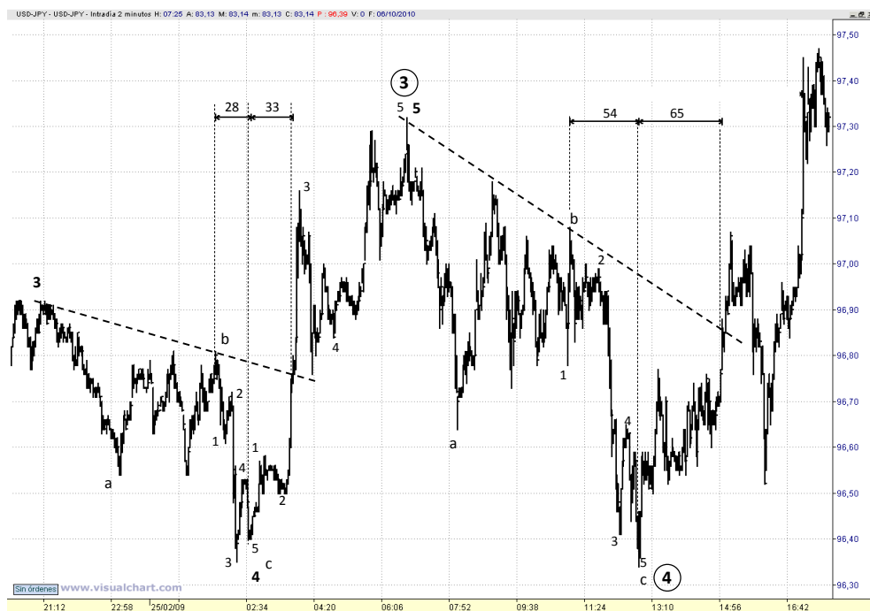
Fig. 39.- Dólar-Yen. Gráfico de 2m.

Pues las he seleccionado porque ninguna de las dos es confirmada según los requisitos teóricos que estudiamos en el apartado 2.5.